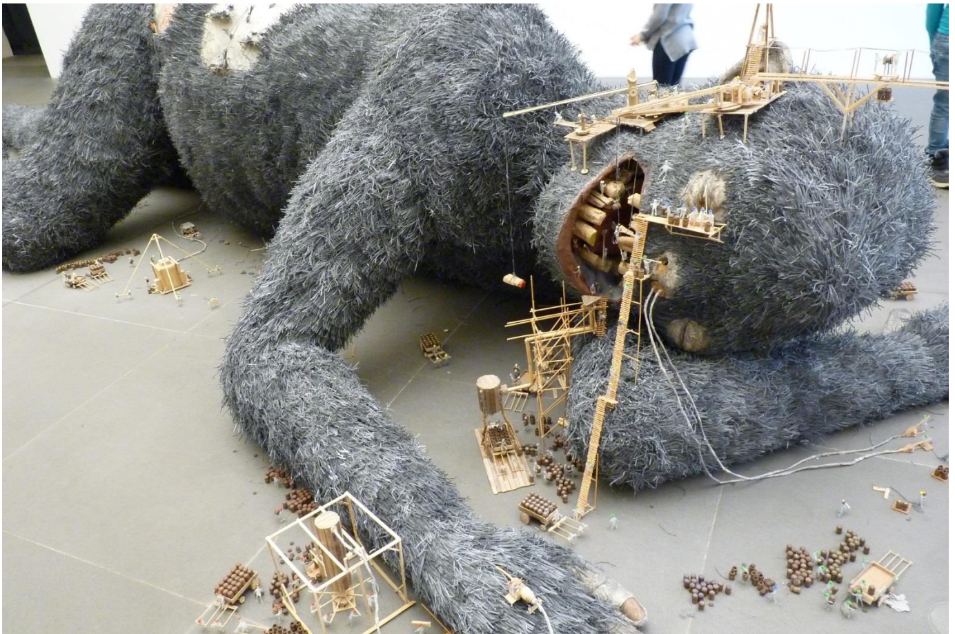
Bild ist entstanden im staatlichen Museum für Kunst und Design in Nürnberg.