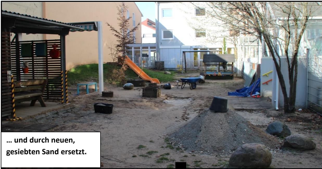
... und durch neuen, gesiebten Sand ersetzt.